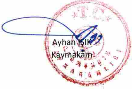
Ayhan İSLİK Kaymakam

2015 yılında ilçemizde Merkezinde 2, Ortaklar Mahallesinde 1 , Hıdırbeyli Mahallesinde 1 ve Mursallı Mahallesinde 1 olmak üzere belirlenen toplam 5 toplantı ve gösteri yürüyüşü yer ve güzergahında değişiklik yapılmasını gerektiren bir durumun olmadığı anlaşıldığından, mevcut güzergahların geçerlilik ve gerekliliğini koruduğu, güzergah değişiklikleri yapılmasına ihtiyaç olmadığına karar verilmiştir. 07.01.2021 – S: 14:30